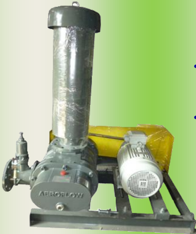
Máy thổi khí