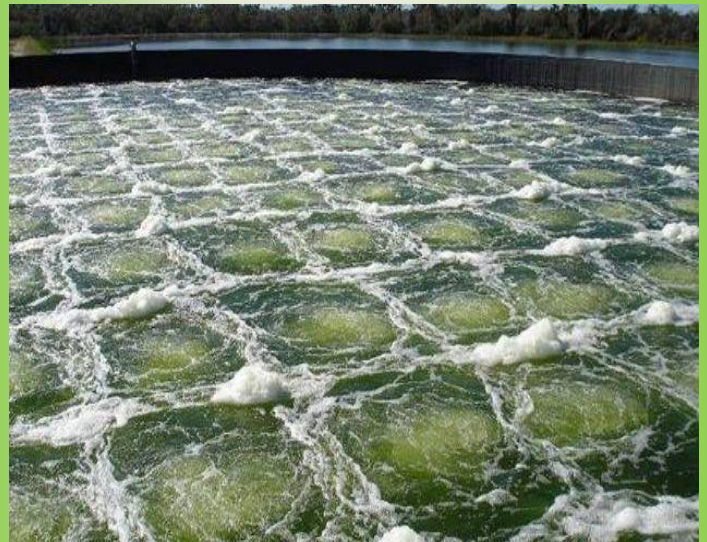
Bể sục khí