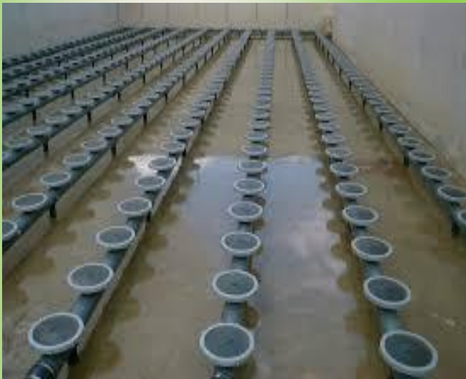
Hệ thống đĩa phân phối khí